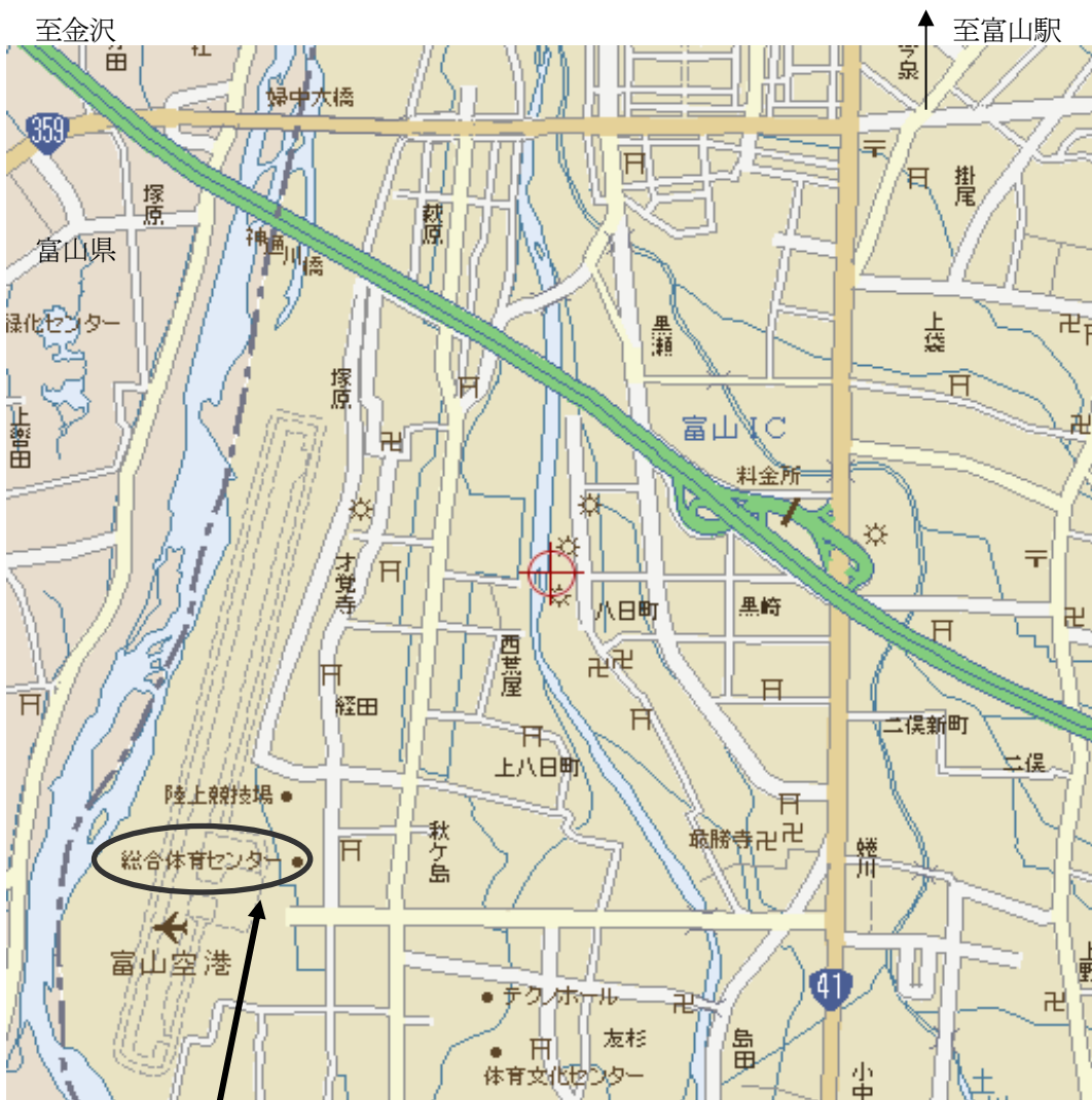
富山県総合体育センター ( 富山市秋が島 183 )